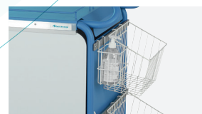
PANIER LATÉRAL SUPPLÉMENTAIRE RÉF. : 601.034