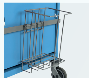
SUPPORT 1 SAC POUBELLE RÉF. : 601.039