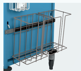
SUPPORT 2 SACS POUBELLE RÉF. : 601.0392