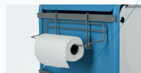
PORTE ROULEAU RÉF. : 601.035