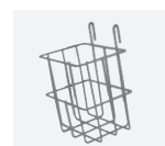
SUPPORT BOÎTE À GANTS OU GEL RÉF. : 601.036